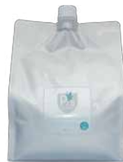
詰替専用「peesガード」 2.3L (減容容器入) ×4本/箱